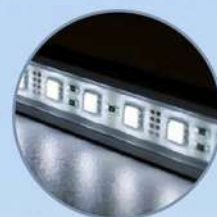
Luce interna LED