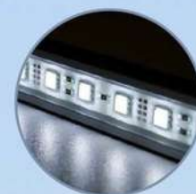
Luce interna LED