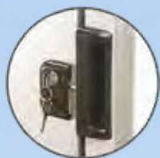
Serratura con chiave