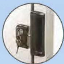
Serratura con chiave