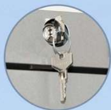
Serratura con chiave