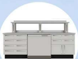
Sottobanco da Incasso