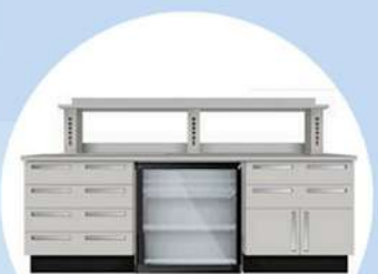
Sottobanco da Incasso