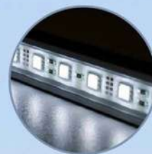
Luce interna LED