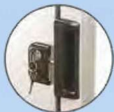
Serratura con chiave