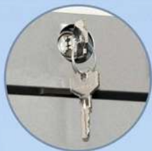
Serratura con chiave